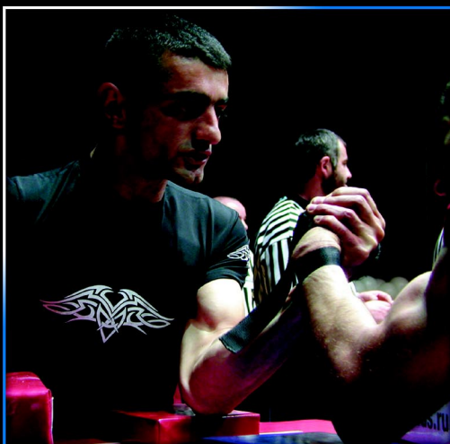
Kategorię do 60kg zwyciężył mistrz świata i Europy - Gocha Gobozov.