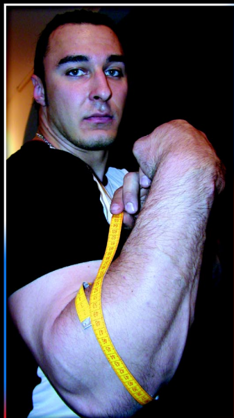
Na życzenie naszych Czytelników zamierzaliśmy największą gwiazdę XIII Mistrzostw Rosji- Alexeya Voevodę. Wzrost: 195 cm; Waga: 122 kg; Biceps: 55cm; Przedramię: 48cm