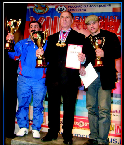
Klasyfikacja drużynowa; I miejsce- RSO Alania, II miejsce- Dagestan, III miejsce - Sankt Petersburg