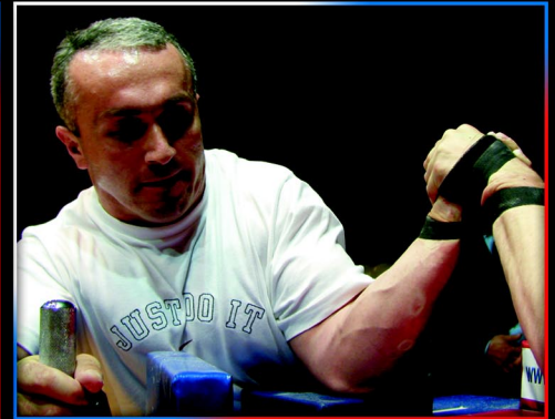
Po raz kolejny tytuł mistrza Rosji zdobył Khabulov Bondo. Jak zapewniał redakcję Armpowera, w tym roku zobaczymy go jeszcze na XIV Mistrzostwach Europy i Złotym Turze.