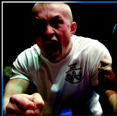
Podczas XIII Mistrzostw Rosji nie było łatwych pojedynków.