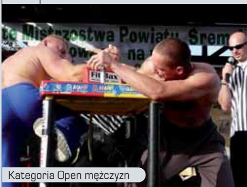
Kategoria Open mężczyźni