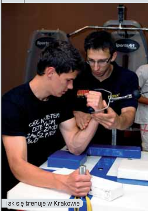
Tak się trenuje w Krakowie