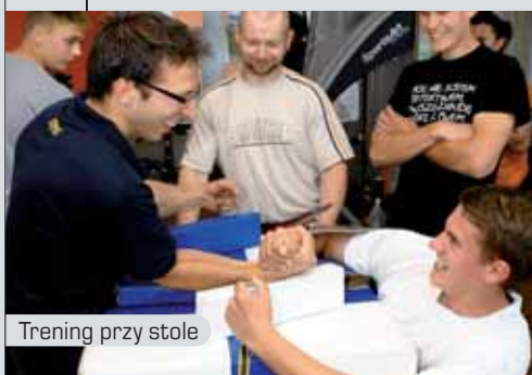
Trening przy stole

Armwrestling to piękna dyscyplina sportu, w której poza siłą liczy się także wyćwiczona technika, wiara w siebie i wytrwałość. Uczy wygrać i przegrywać oraz przelamywać własne słabości. Daje satysfakcję z pełnego kontaktu z przeciwnikiem, a potencjalnych rywali uczyni najlepszymi przyjaciółmi, nawet i do końca życia. Siłowanie na ręce może uprawiać każdy kto tylko ma do tego choć trochę chęci. Osoby, które na co dzień rozpiera energia, doskonale mogą spożytkować ją przy stole, osiągając przy tym sporą satysfakcję. Dyscyplina ta jest otwarta dla wszystkich, zarówno tych młodszych, jak i starszych ludzi. Pole do popisu mają tutaj również osoby niepełnosprawne. Chcąc poprawić swoją koordynację ruchu oraz nabrać wiary w siebie z całą pewnością powinni spróbować się w tej właśnie dyscyplinie sportu.