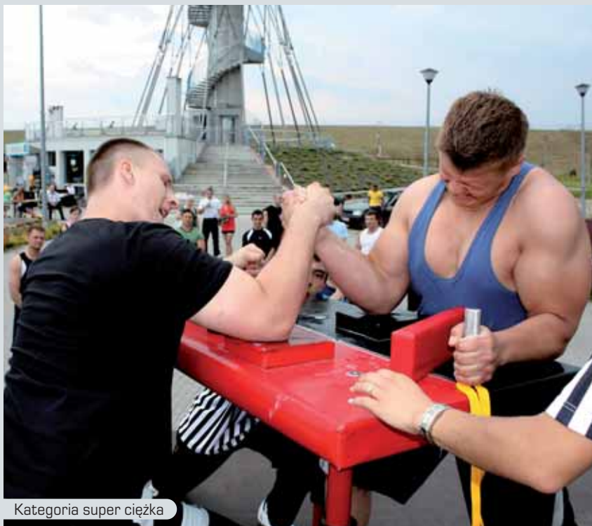
Kategoria super ciężka