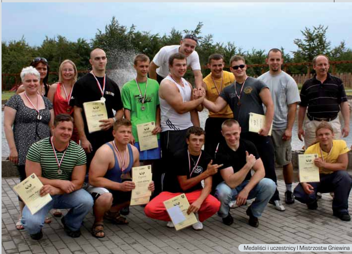
Medaliści i uczestnicy I Mistrzostw Gniewina