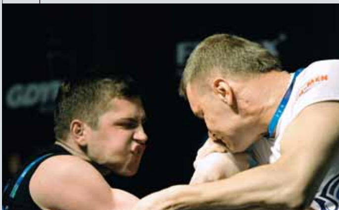
Dobre przygotowanie prezentował każdy