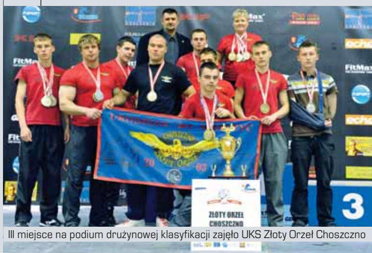
III miejsce na podium drużynowej klasyfikacji zajęło UKS Złoty Orzeł Choszczno

Znamy już Mistrzów Polski roku 2010 w poszczególnych kategoriach wiekowych i wagowych ręki lewej i prawej. Ale całe, jednodniowe Mistrzostwa Polski odbywały się bez żadnych emocji, w wielkiej zadumie, przemyśleniach i refleksji