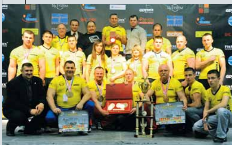
Organizator UKS Złoty Tur Gdynia – miejsce II na drużynowym podium