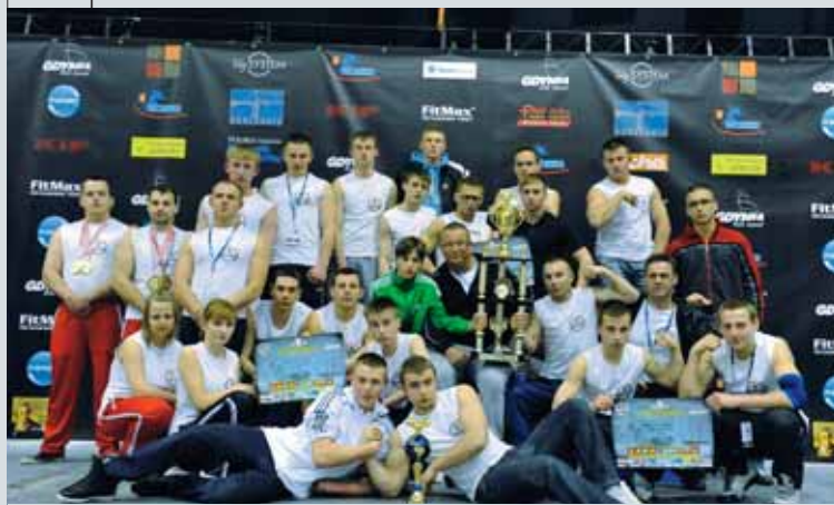
Drużynowy Mistrz Polski – Szaki Club Żary